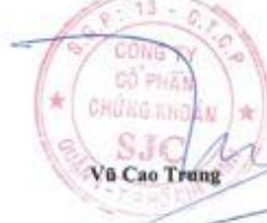
Võ Cao Trung